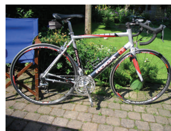
De fiets staat weer klaar

“Zo langzamerhand begint het bij de meeste toch wel te kriebelen”